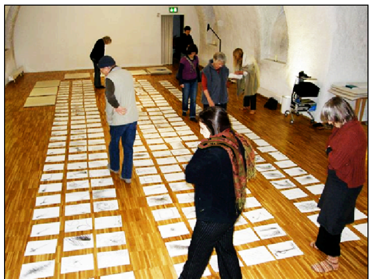
Der Weg ergibt sich im Voranschreiten